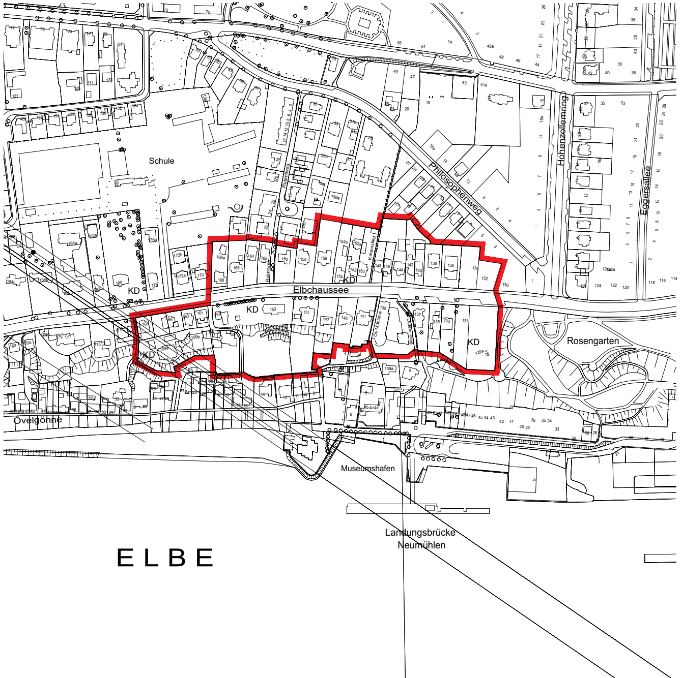
Lageplan M 1:5000

– Teilbereich 3, Elbchaussee Nummern 129 bis 169 und Nummern 132 bis 168 –