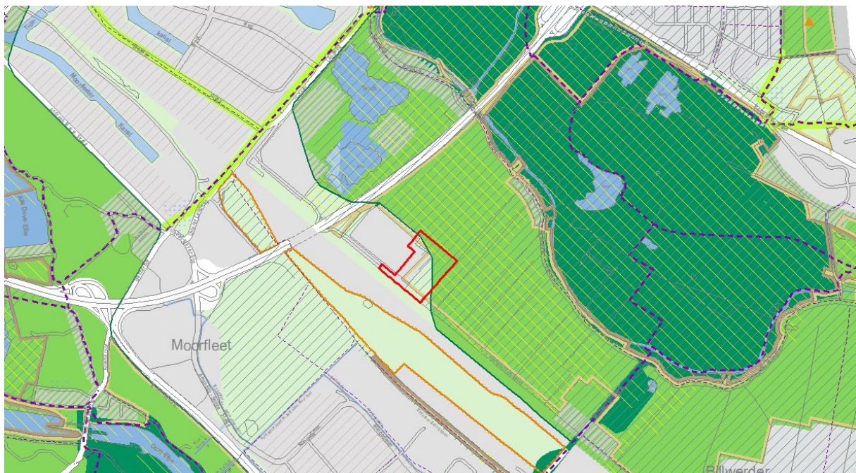
Abb.: Ausschnitt aus der Fachkarte „Grün Vernetzen“ des Landschaftsprogramms der FHH

Die Landschaftsachsen, die beiden Grünen Ringe sowie die gesamtstädtisch bedeutsamen Grünverbindungen und die sonstigen Parkanlagen bilden das Grundgerüst des Freiraumverbundsystems, genannt „Grünes Netz Hamburg“. Die im Landschaftsprogramm Hamburg dargestellten Landschaftsachsen und Grünen Ringe sind in der Fachkarte „Grün Vernetzen“ von 2018 bezüglich der Abgrenzungen überarbeitet worden (siehe unten stehenden Planausschnitt). Das Plangebiet ist Teil der Bille-Landschaftsachse. Die Abgrenzungen in der Fachkarte „Grün Vernetzen“ sind maßgeblich für die Anwendung der Schutz- und Kompensationsregelung gemäß Drucksache 21/16980 (siehe Kap. 3.3.3).