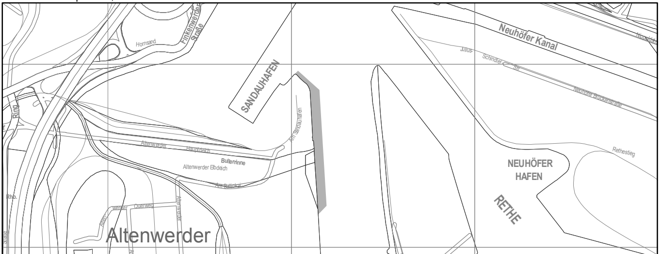
Arten- und Biotopschutz, ANGEPASST nach Planfeststellung